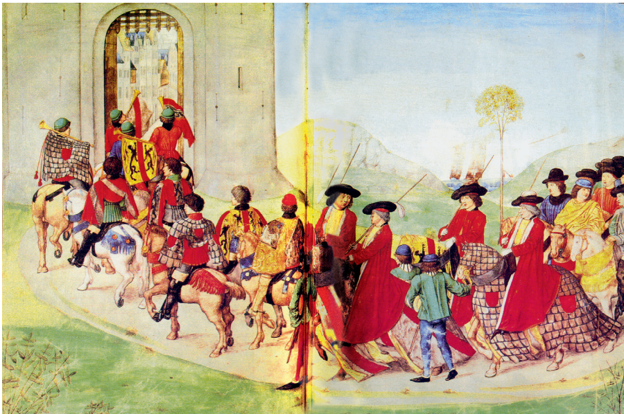
Farbtafel 5: Einzug der vornehm gekleideten Turnierkämpfer zu Pferde in die Stadt