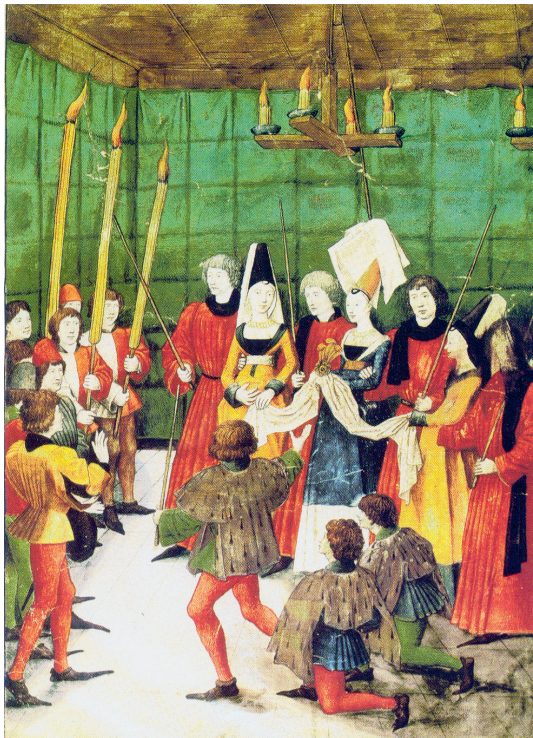
Farbtafel 7: Überreichung der Turnierpreise aus der Hand der Damen