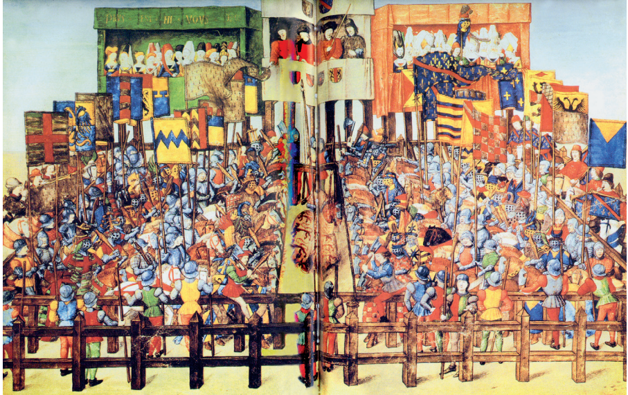
Farbtafel 6: Szene kurz vor Beginn des mannschaftlichen Kolbenturniers