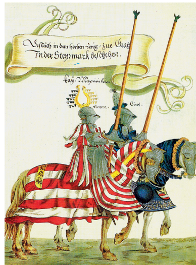
Farbtafel 9: Gestech im hohen Zeug