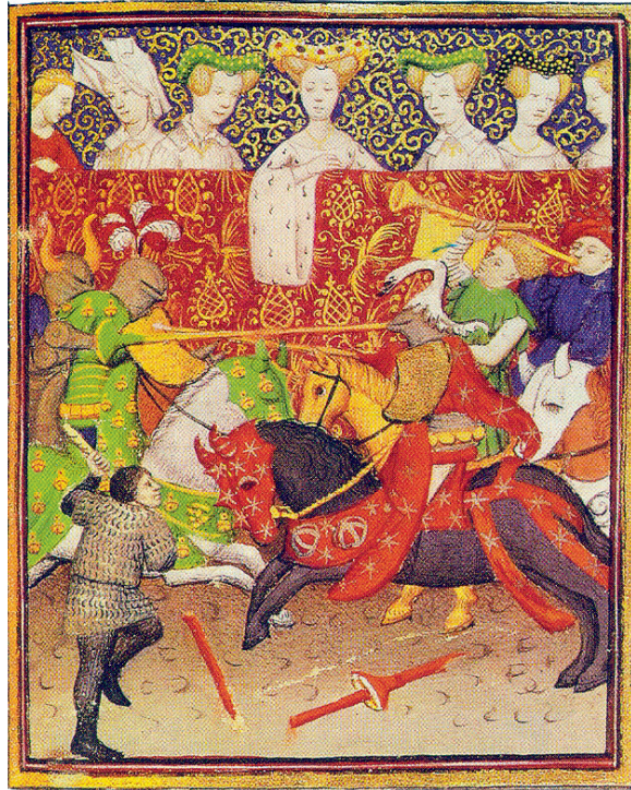
Farbtafel 4: Beteiligung der Damen im Turnier