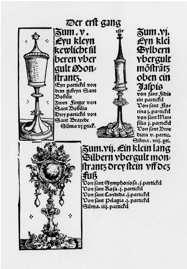
Abb. 15: Drei Reliquiare aus dem Wittenberger Heiltumsbuch mit Angabe der enthaltenen Reliquien, Holzschnitt 1509, I. Gang, fol. ivv