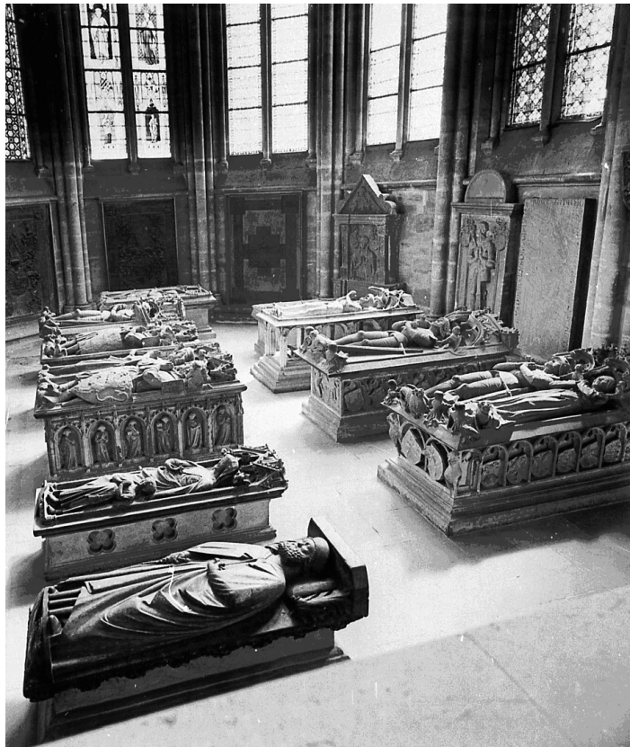
Abb. 150: Marburg, Elisabethkirche. Südkonche mit der Grablege der Landgrafen von Thüringen und Hessen, 13. bis 16. Jahrhundert, nach: Bildarchiv Foto Marburg, M107135b05.