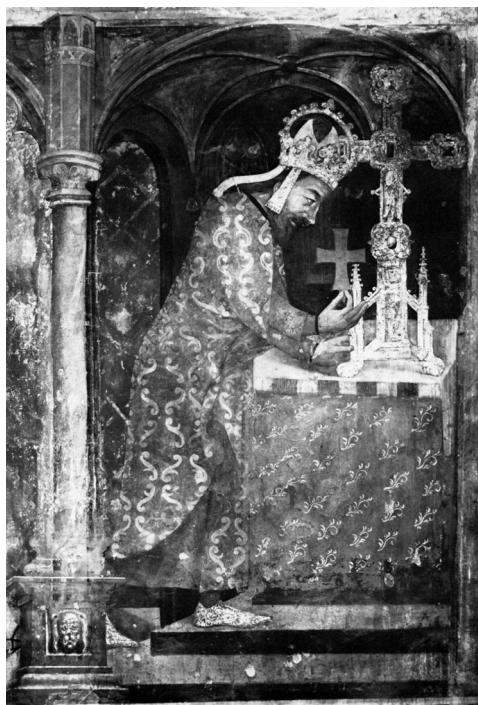
Abb. 152: Karl IV. fügt Kreuzpartikel in ein Altarkreuz ein (Ausschnitt). Karlstein, Marienkapelle, nach: SCHRAMM/FILLITZ 1978, Tafel 46.

Sonderdruck aus: Höfe und Residenzen im spätmittelalterlichen Reich.