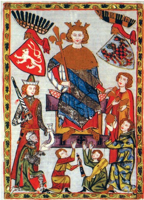
Farbtafel 142: Miniatur aus der Manesse-Handschrift, um 1320. Universitätsbibliothek, Heidelberg, Cod. Pal. Germ. 848, fol. 10 r, nach: BACHFISCHER 1998, S. 129.

Sonderdruck aus: Höfe und Residenzen im spätmittelalterlichen Reich.