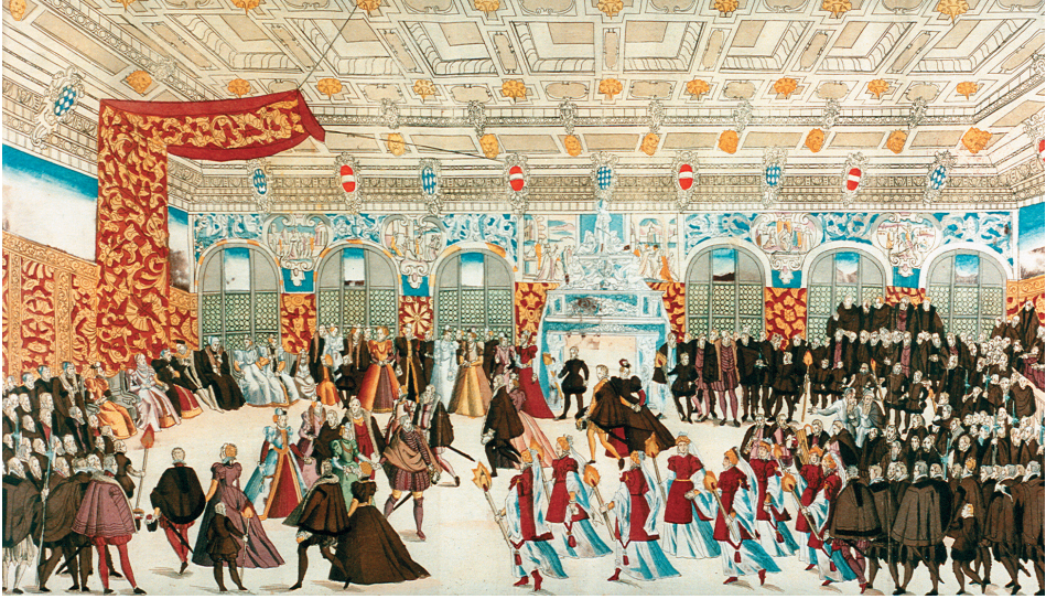
Farbtafel 141: Patriarchenmummerei 1568 in München. Nicolaus Solis. Kolorierter Kupferstich, aus: Johann Wagner: Kurtze doch gegründete beschreibung des [...] Herren Wilhalmen / Pfaltzgrauen bey Rhein [...] Und Frewlein Renata [...] Hochzeitlichen Ehren Fests [...], München 1568, vor fol. 44 r. HAB Wolfenbüttel, Gm 2° 131.