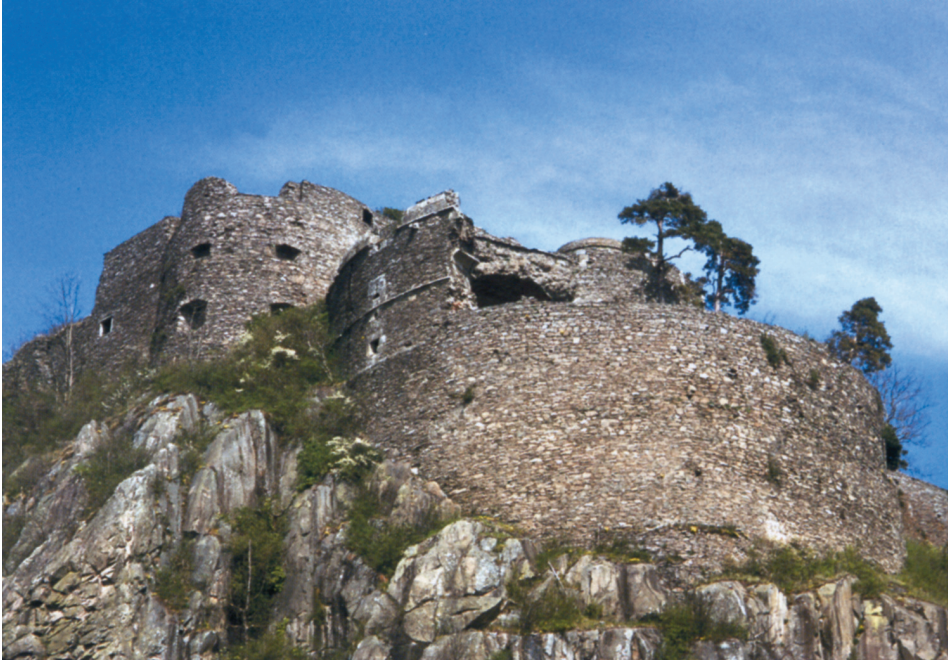
Farbtafel 43: Festung Hohentwiel, Rondell Augusta. Photo Michael LOSSE, 2004.