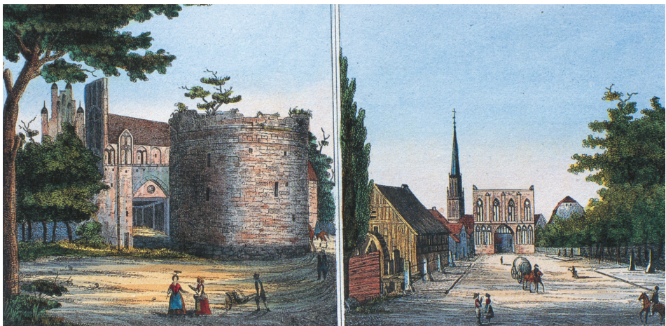
Farbtafel 44: Neubrandenburg, Friedländer und Stargarder Tor, nach: LISCH, Georg Christian Friedrich: Mecklenburg in Bildern. Mit geschichtlichen Erläuterungen, Neuausgabe hg. von Hanno LIETZ und Peter-Joachim RAKOW (Originalausgabe 1842–1845), Bremen 1994, S. 157.

Sonderdruck aus: Höfe und Residenzen im spätmittelalterlichen Reich.