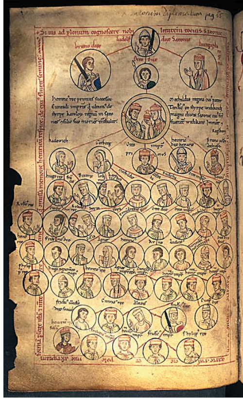
Farbtafel 61: Nachfahrentafel Kaiser Heinrich I., Pergament. 191 Bl., 28,5 × 19,5 cm, 4 lavierte und kolorierte Federzeichnungen. Um 1237 (?). Köln, St. Pantaleon. HAB Wolfenbüttel Cod. Guelf. 74.3 Aug. 2°, fol. 114 v. [ www.hab.de/ausstellung/ma-erzaehlt/mao2.htm (17.05.2005)].