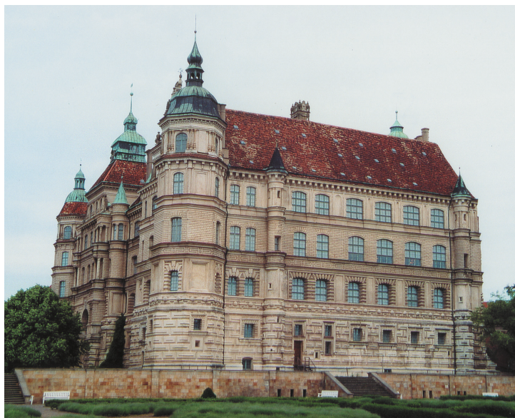
Farbtafel 95: Residenzschloß in Güstrow, Ansicht von Südwesten.

Sonderdruck aus: Höfe und Residenzen im spätmittelalterlichen Reich.