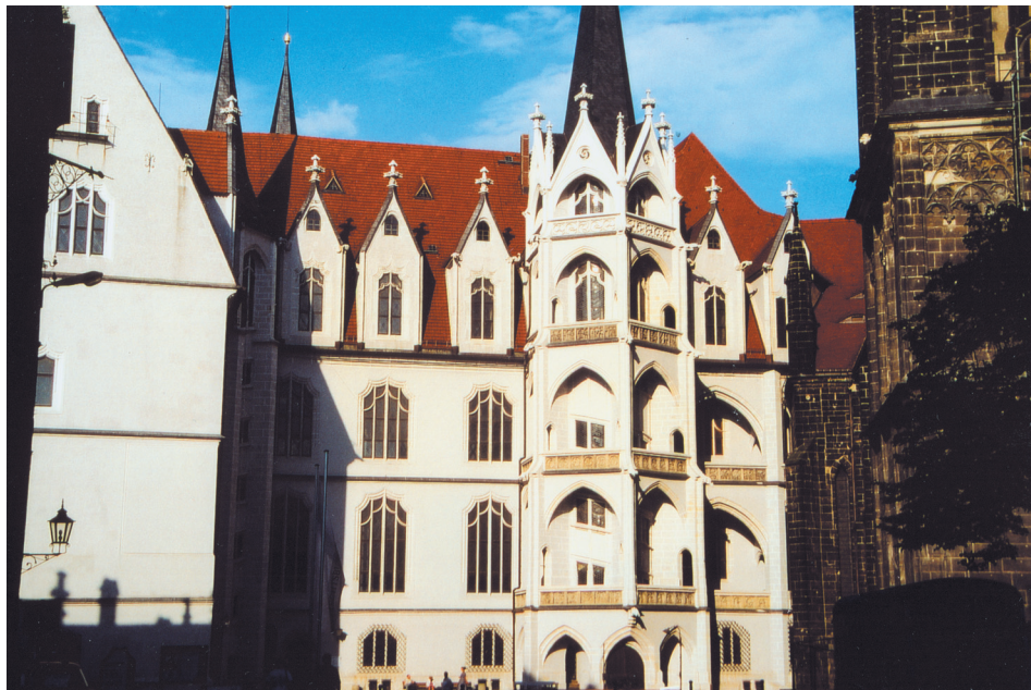
Farbtafel 94: Albrechtsburg oberhalb von Meißen.