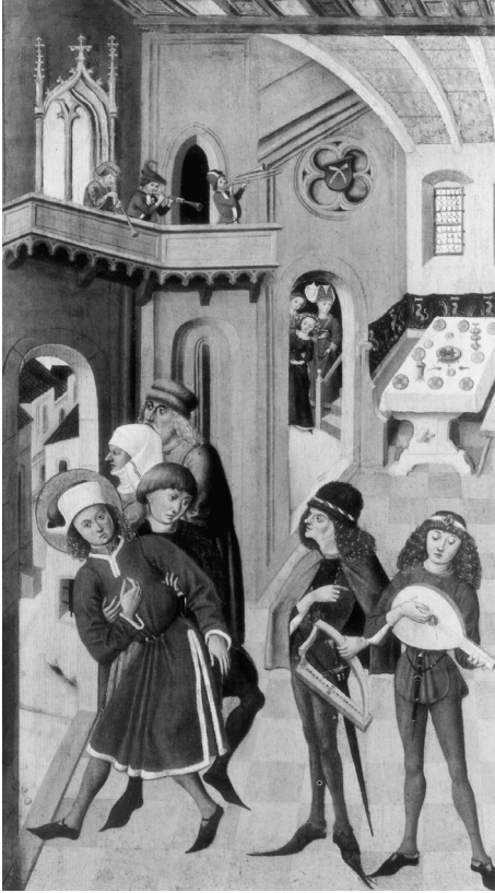
Abb. 72: Wandfeste Bank mit Rücklaken, Kastentisch mit sichtbarer Konstruktion. Gabriel Mälesskircher: Der heilige Veit weigert sich, zum Bankett zu gehen, 1476. Bayerische Staatsgemäldesammlungen, München, nach: Staatsgalerie Burghausen, hg. von Gisela GOLDBERG und Rüdiger AN DER HEIDEN, München u.a. 1989, S. 13.