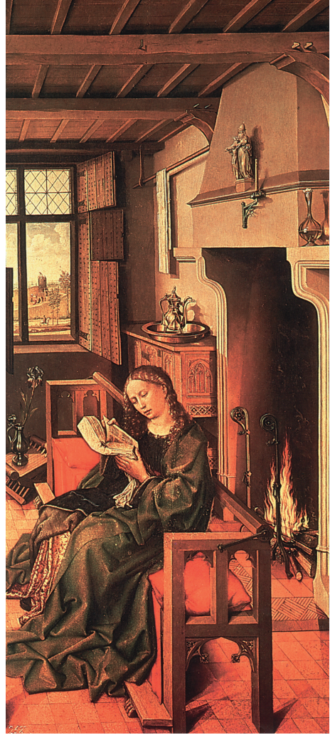
Farbtafel 26: Bank mit verstellbarer Lehne und Falthocker. Robert Campin (1375–1444): Die heilige Barbara. Madrid, Museo Nacional del Prado, nach: HINZ 1989, Abb. III.