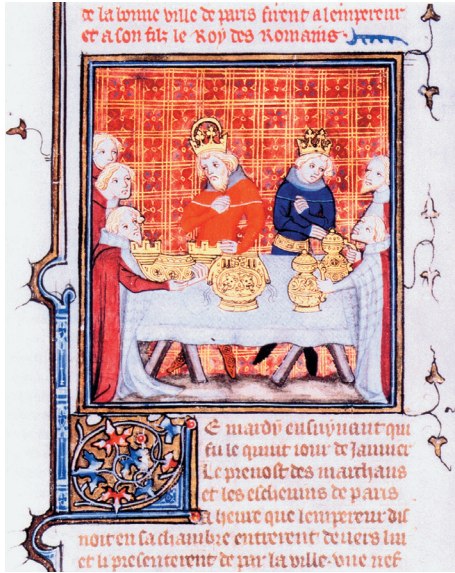
Farbtafel 25: Kaiser Karl IV. empfängt 1378 die Geschenke der Stadt Paris. Grandes Chroniques de France. Frankreich, letztes Viertel 14. Jahrhundert. BNF, ms. fr. 2813, fol. 472, nach: Die öffentliche Tafel, 2002, S. 36.