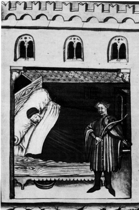
Abb. 117: »Sompnus«, italienische Miniatur aus dem Ende des 14. Jahrhunderts, aus: Tacunium sanitatis in medicina (Hausbuch der Cerruti). Österreichische Nationalbibliothek, Wien, Cod. Se. Nov. 2644, nach: SALMEN 1983, S. 218, Abb. 117.