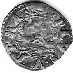
Abb. 161: Plus ultra – Devise Karls V. Umschrift auf einer Münze aus der Zeit Karls V. (Neapel, Cinquina), nach: The Abraham Cowley Text and Image Archive, etext.lib.virginia.edu/kinney/small/n21.htm (20.05.2005).