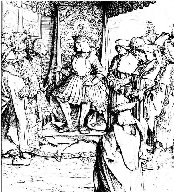
Abb. 141: Der Weißkunig im Kreis der Räte und Hauptleute. Holzschnitt Hans Burgkmairs d.Ä., nach: Der Weiß Kunig. Eine Erzählung von den Thaten Kaiser Maximilian des Ersten von Marx TREITZSAURWEIN auf dessen Angaben zusammengetragen, nebst den von Hannsen Burgmair dazu verfertigten Holzschnitten, Wien 1775. ND mit einem Kommentar von Christa-Maria DREISSIGER, Weinheim 1985, Abb. 137, nach dem Exemplar der Sächsischen Landesbibliothek – Staats- und Universitätsbibliothek Dresden und dem dort befindlichen Konvolut der Holzschnitte zum Weißkunig.