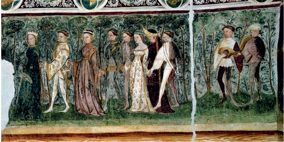
Farbtafel 45: Der Reigentanz, Tuniersaal, Schloß Runkelstein.