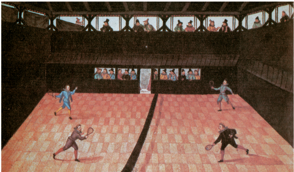
Farbtafel 46: Studenten des Collegium Illustre in Tübingen spielen Tennis (1610). Stundenbuch Herzog Augusts des Jüngeren zu Braunschweig und Lüneburg. HAB Wolfenbüttel Cod. Guelf. 84.6 Aug. 40, nach: GILLMEISTER, Heiner: Kulturgeschichte des Tennis, München 1990, Abb. 58.

Sonderdruck aus: Höfe und Residenzen im spätmittelalterlichen Reich.