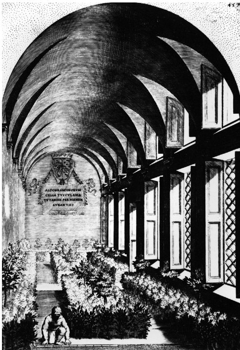
Abb. 229: Gewölbter Saal für Orangenbäume in der Villa Aldobrandini, aus: Giovanni Battista Ferrari: Hesperides 1646, p. 457.

Sonderdruck aus: Höfe und Residenzen im spätmittelalterlichen Reich.