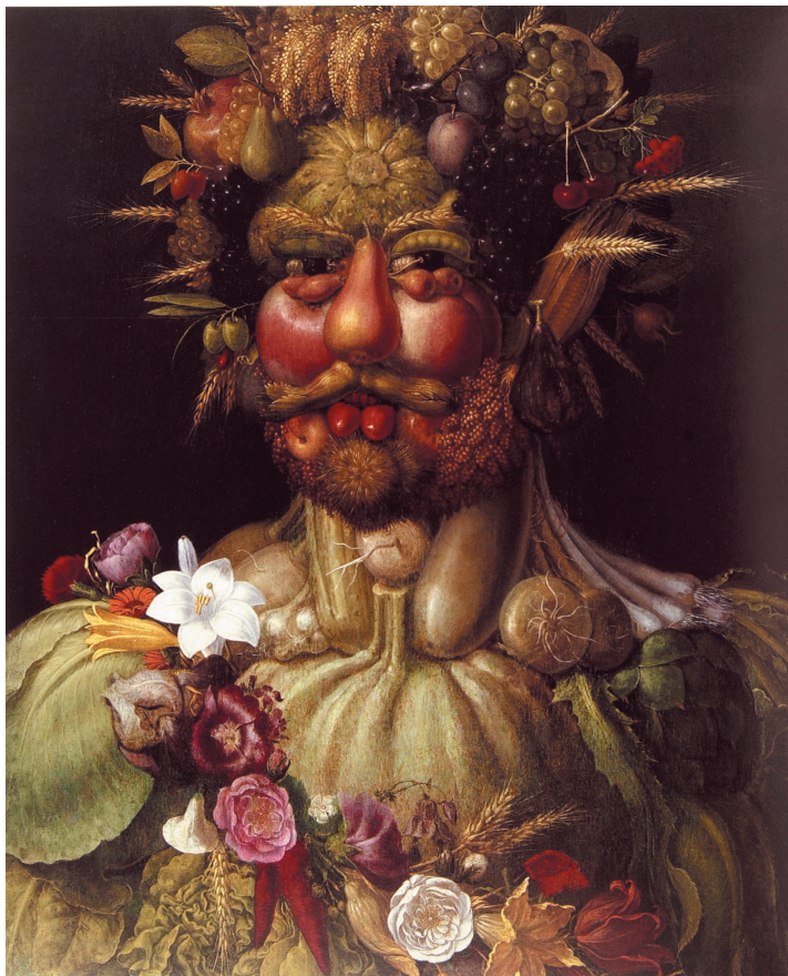
Farbtafel 86: Rudolf II. als Vertumnus. Giuseppe Arcimboldo, um 1591, Öl auf Holz. Ehemals Prager Kunstammer, heute Schloß Skokloster, Schweden, nach: SCHNEIDER, Norbert: Porträtmalerei. Hauptwerke europäischer Bildniskunst 1420–1670, Köln 1992, S. 122.