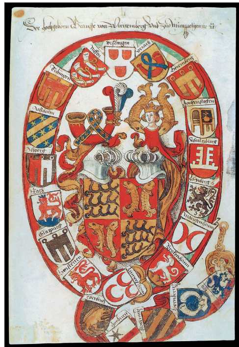
Farbtafel 66: Das Wappen der Grafen von Württemberg. Wappenbuch des Konrad Grünenberg, 1483, SMPK, Geheimes StA, Berlin, Abt. Merseburg, fol. 51 r, nach: 1495. Württemberg wird Herzogtum. Dokumente aus dem Hauptstaatsarchiv Stuttgart zu einem epochalen Ereignis (Ausstellungskatalog), bearb. von Stephan MOLITOR, Stuttgart 1995, Abb. 1.

Sonderdruck aus: Höfe und Residenzen im spätmittelalterlichen Reich.