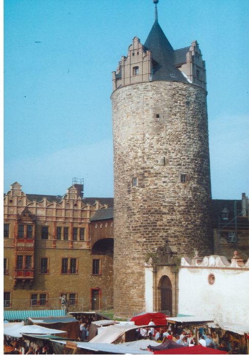
Farbtafel 65: Eulenspiegel-Turm im Hof von Schloß Bernburg.