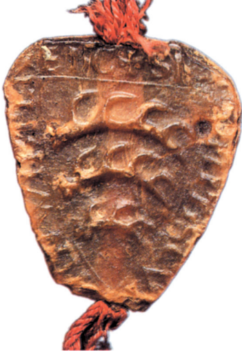
Farbtafel 67: Wappensiegel Graf Konrads von Württemberg-Grünlingen (verwendet 1228), nach: 1495. Württemberg wird Herzogtum. Dokumente aus dem Hauptstaatsarchiv Stuttgart zu einem epochalen Ereignis (Ausstellungskatalog), bearb. von Stephan MOLITOR, Stuttgart 1995, Abb. 4.