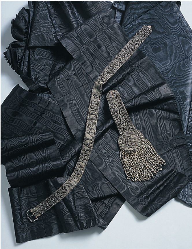
Farbtafel 68: »Honni soit, qui mal y pense.« Devise des Hosenbandordens. Das Bild zeigt ein Exemplar des 18. Jahrhunderts

Sonderdruck aus: Höfe und Residenzen im spätmittelalterlichen Reich.