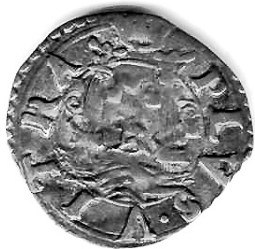
Abb. 161: Plus ultra – Devise Karls V. Umschrift auf einer Münze aus der Zeit Karls V. (Neapel, Cinquina), nach: The Abraham Cowley Text and Image Archive, etext.lib.virginia.edu/kinney/small/n21.htm (20.05.2005).