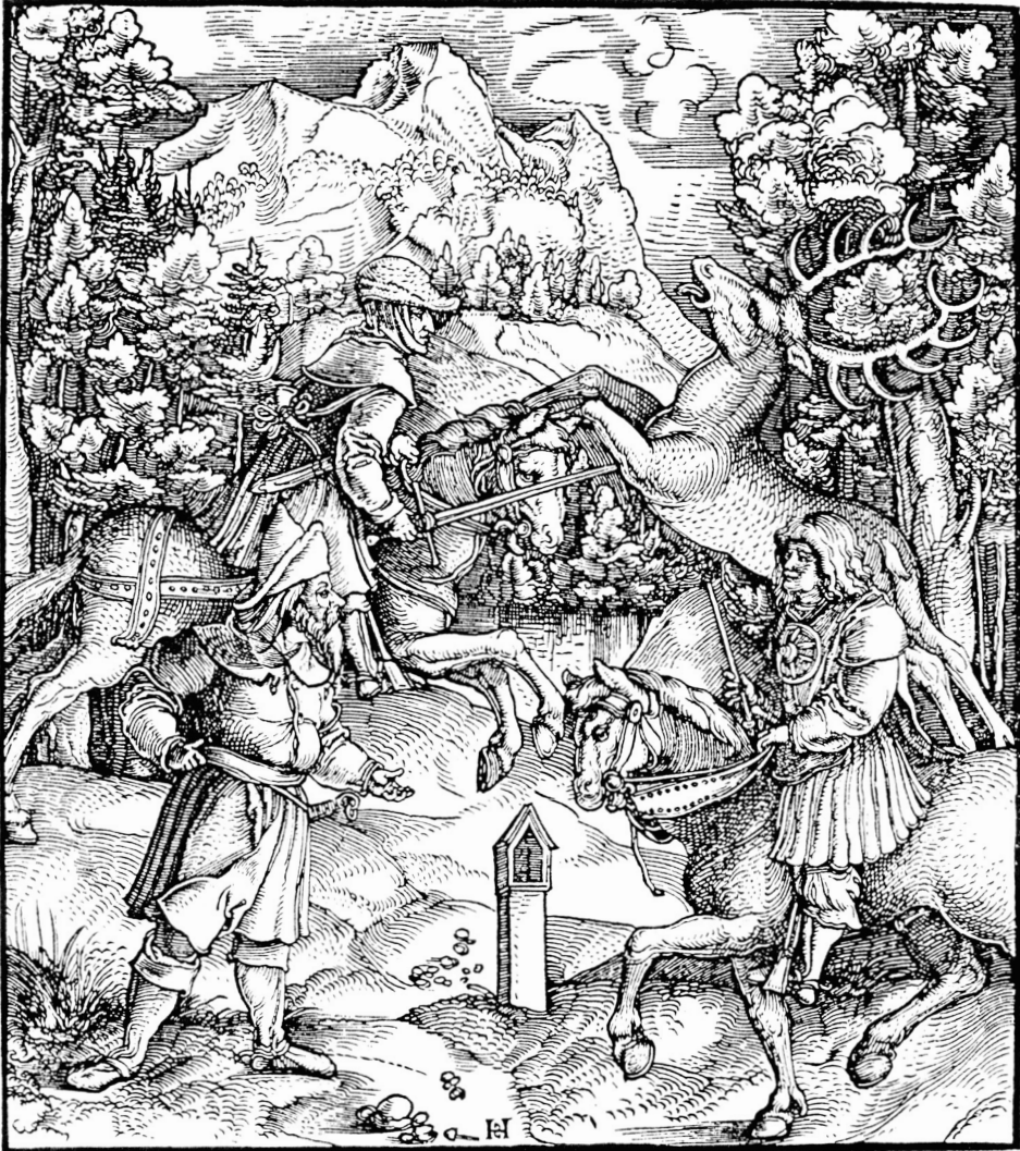
Abb. 177: Hirschjagd mit dem Jagdschwert. 13. Abenteuer des Theuerdank, nach: NIEDERWOLFSGRUBER 1965, Abb. 9.