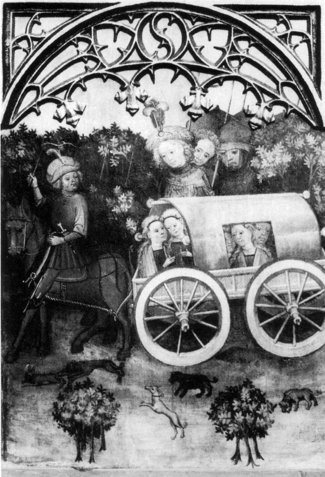
Abb. 81: Reisewagen. Ausschnitt aus: Gemälde mit einer Szene aus dem Leben der heiligen Elisabeth – hier: Reise der vierjährigen Elisabeth von Ungarn zu ihrem künftigen Gatten nach Eisenach, um 1430 (Lübeck, St.-Annen-Museum), nach: BOOCKMANN, Hartmut: Die Stadt im späten Mittelalter , München 1986, S. 20, Abb. 17.