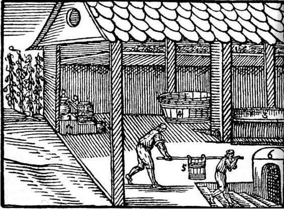
Abb. 80: Die einfache Einrichtung des Brauhauses, aus: Johann Amos Comenius, Orbis sensualium pictus , gedruckt auf tschechisch in Nürnberg 1658: »Das Bier ist [...] aus Malz (1) und Hopfen (2) im Kessel (3) gebräut, dann ergießt sich es auf Rinnen (4) und erkaltet in Eimern (5), wird in den Keller (6) fortgetragen und in Fässer gefüllt«, nach: PETRÁN, Josef: Dejiny hmotné kultury II/1 . Prag 1995, S. 384, Abb. 168.