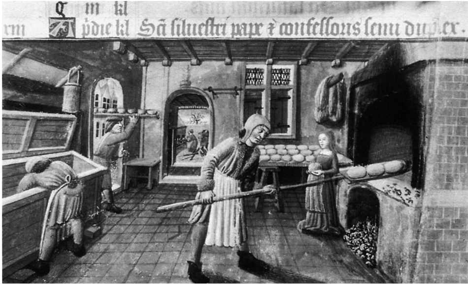
Abb. 78: Bibliothèque municipale Lyon, Missel, Ms 514, nach: DESPORTES, Françoise: Le pain au moyen âge , Paris 1987, Abb. zwischen S. 124–125.