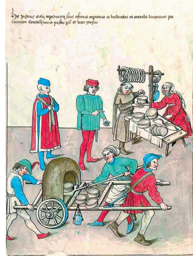
Farbtafel 29: Die Straßenbäcker und Brezelbäcker. Nationalbibliothek der Tschechischen Republik Prag, Sign. VII A 18, 1470/80: Ulrich Riechenthal, Chronicon Concilii Constantiensis , fol. 27 v, nach der Manuskriptdatenbank auf: www.memoria.cz (25.07.2005).