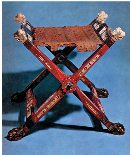
Farbtafel 27: Faltstuhl einer Äbtissin (Faldistorium), Salzburg (?), um 1242. Salzburg, Kloster Nonnberg, nach: KREISEL 1981, S. 13.