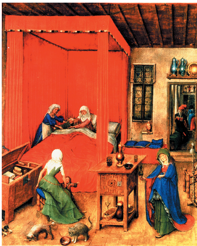
Farbtafel 28: Geöffnete Truhe, Stollenschrank. Jan van Eyck (um 1390–1441) und Gehilfen: Geburt Johannes des Täufer. Miniatur aus dem Turiner Stundenbuch, um 1415–1417. Turin, Museo Civico d'Arte Antica, nach: HINZ 1989, Abb. 98.

Sonderdruck aus: Höfe und Residenzen im spätmittelalterlichen Reich.