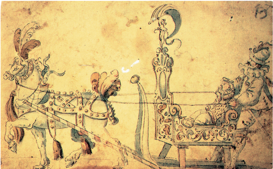
Farbtafel 34: »Fortuna«-Schlitten, Kolorierte Federzeichnung aus dem Jost-Amman-Kreis, um 1570. Nürnberg, Germanisches Nationalmuseum, nach: MOSER, Dietz-Rüdiger: Maskeraden auf Schlitten. Studentische Faschings-Schlittenfahrten im Zeitalter der Aufklärung, München 1988, S. 64.

Sonderdruck aus: Höfe und Residenzen im spätmittelalterlichen Reich.