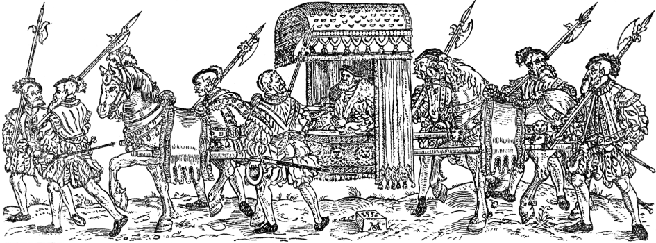
Abb. 86: Ein Fürst auf Reisen. Kurfürst Friedrich II. von Bayern. Holzschnitt von Michael Ostendorfer, 1556