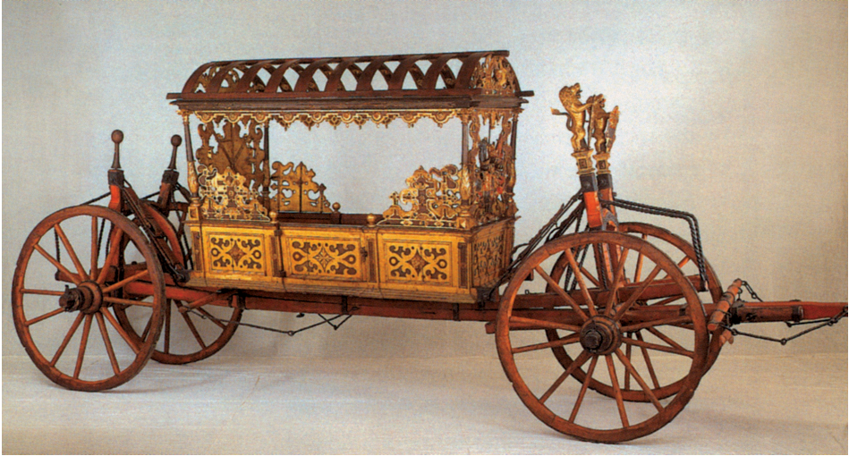
Farbtafel 33: Prunkwagen der Prinzessin Dorothea von Dänemark, um 1560. Veste Coburg, Inv.-Nr. XII/3, nach: WACKERNAGEL 2002, S. 20, Abb. II.