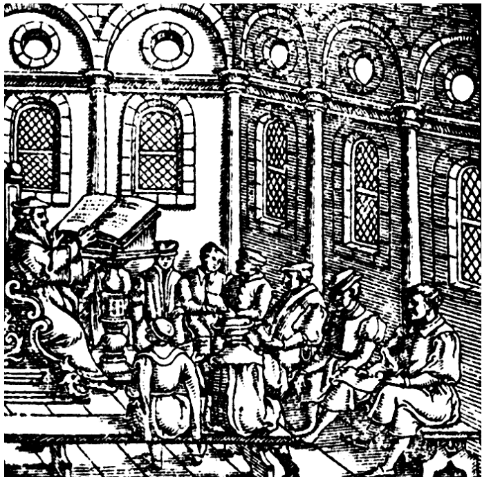
Abb. 127: Unterricht in der Tübinger Universität, nach: Sebastian Münster, 1628, S. 1016.