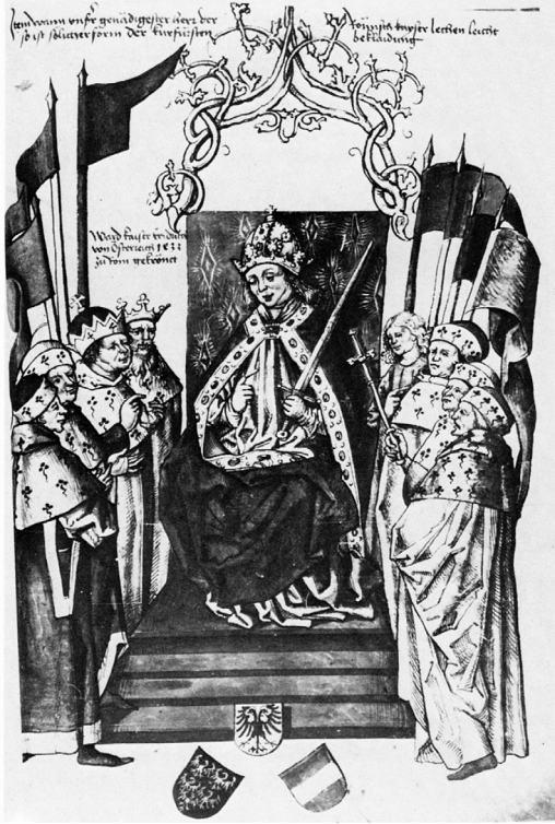
Abb. 154: Kaiser und Kurfürsten bei einem Belehnungsakt. Wappenbuch des Conrad von Grüenberg von 1483, nach: HOFFMANN 1982, Tafel 27.