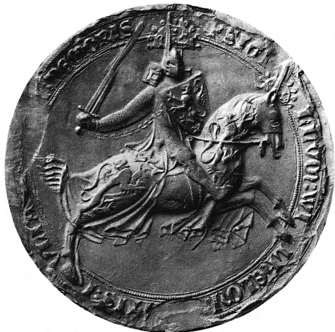
Abb. 157: Siegel Graf Wilhelms V. von Jülich (verwendet zwischen 1328 und 1336), nach: EWALD, Wilhelm: Rheinische Siegel, Bd. 6: Siegel der Grafen und Herzöge von Jülich, Berg, Kleve, Herrn von Heinsberg, Bonn 1963, Tafel 3, Abb. 9.