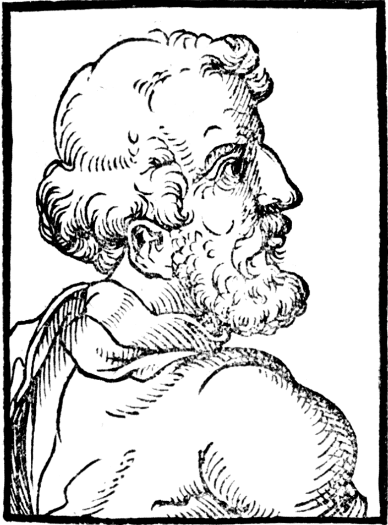
Abb. 170: Idealtypische Darstellung von Lorenz Fries, aus: Heinrich Pantaleon, Prosopographia heroum atque illustrium virorum totius Germaniae, pars III , Basel 1566, S. 215.