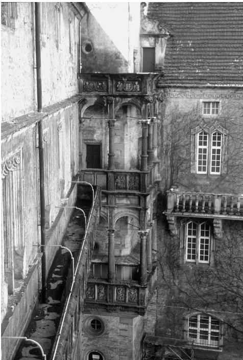
Abb. 198: Torgau, Schloß Hartenfels. Außenlaufgänge an der Hoffassade des Neuen Saalbaues (ab 1533).