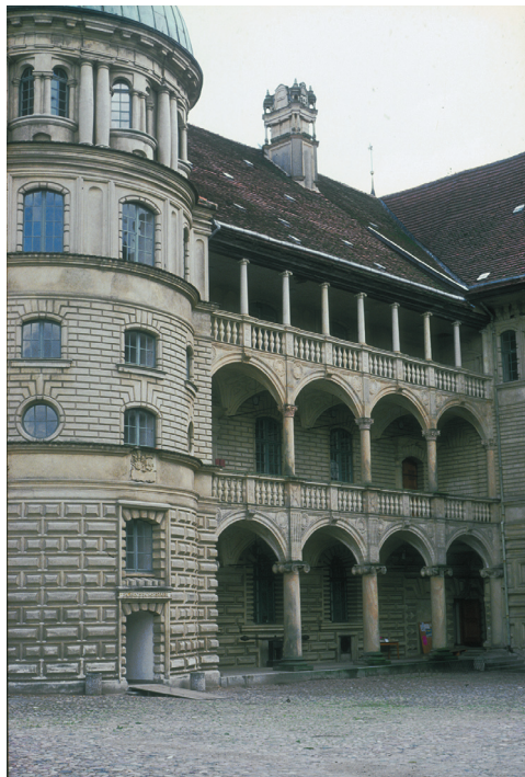
Farbtafel 98: Neuburger Schloß, Detail mit dem sog. Altanbau (oder »Neuen Bau« von 1534–1538). Ansicht von 1536/37. Universitätsbibliothek, Würzburg, Delin 6 [einst: G.f.57], Blatt 1, 295–425 mm.