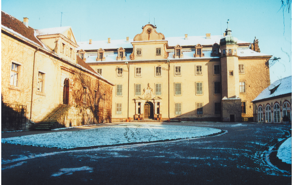
Farbtafel 96: Baden-Baden, Neues Schloß.