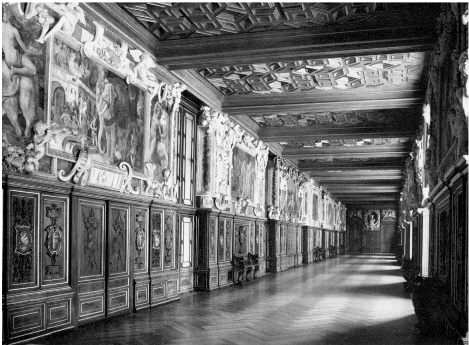
Abb. 216: Fontainebleau, Schloß, Galerie Franz I., 1528–1540, nach: PRINZ, Wolfram: Die Entstehung der Galerie in Frankreich und Italien, Berlin 1970, Abb. 3 oben.