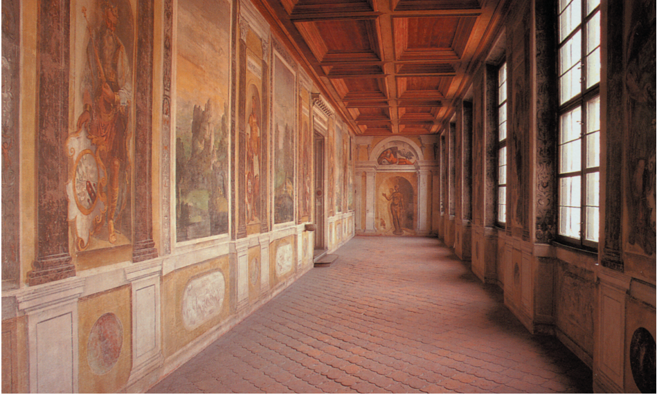
Farbtafel 118: Landshut, Stadtresidenz, Südflügel, Kapellengang mit Ahnengalerie, 1537–1543, nach: Die Landshuter Stadtresidenz, 1998, S. 60 oben.