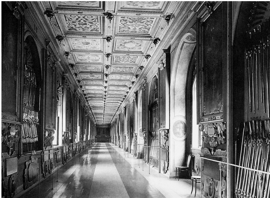
Abb. 217: Dresden, Stallhof, Langer Gang mit Ahnengalerie, 1586–1591, nach: HECKNER, Ulrike: Im Dienst von Fürsten und Reformation. Fassadenmalerei an den Schlössern in Dresden und Neuburg an der Donau im 16. Jahrhundert , München 1995, Abb. 177.