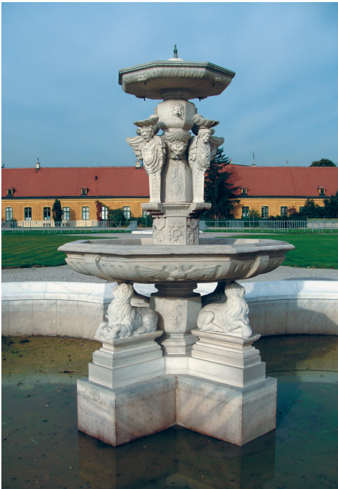
Farbtafel 119: Brunnen für das Neugebäude in Wien von Alexander Colin, um 1574. Um 1760 Wiederaufstellung im Orangeriegarten von Schloß Schönbrunn.

Sonderdruck aus: Höfe und Residenzen im spätmittelalterlichen Reich.