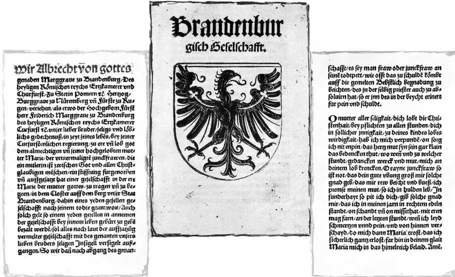
Abb. 279: Statutenbüchlein des Schwanenordens. Titelblatt, Textbeginn und Textende. Druck um 1500. Staatsarchiv Nürnberg, nach: SCHUHMAN, Günther: Die Markgrafen von Brandenburg-Ansbach. Eine Bilddokumentation zur Geschichte der Hohenzollern in Franken, Ansbach 1980 (Jahrbuch des Historischen Vereins für Mittelfranken, 90), S. 411.