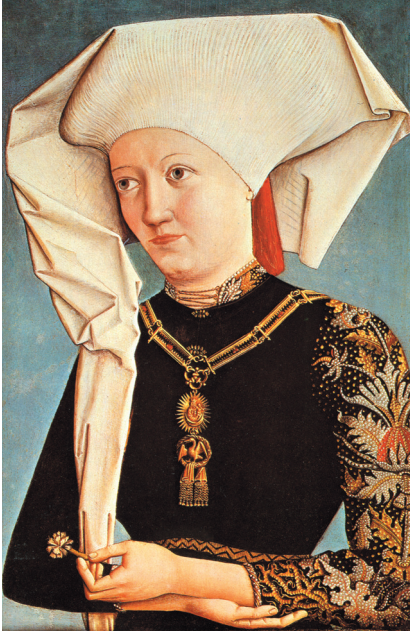
Farbtafel 149: Bildnis einer Dame mit dem Schwanenorden, um 1480. Sammlung Thyssen-Bornemisza, Lugano-Castagnola, nach: SCHUH-MANN, Günther: Die Markgrafen von Brandenburg-Ansbach. Eine Bilddokumentation zur Geschichte der Hohenzollern in Franken, Ansbach 1980 (Jahrbuch des Historischen Vereins für Mittelfranken, 90), S. 408.