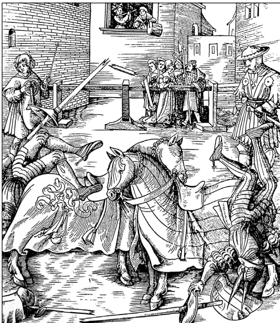
Abb. 282: »Rennen« bei einem Turnier, dem auch die Königin zusieht, nach: Kaiser Maximilian I., Theuerdank, Frankfurt/Main 1563, S. 101.