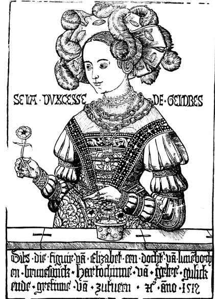
Abb. 281: Porträts des Herzogs Karl von Geldern und seiner Ehefrau Elisabeth, entstanden im Zusammenhang der Vermählung der beiden Fürsten 1519, nach: Das Goldene Zeitalter des Herzogtums Geldern. Geschichte, Kunst und Kultur im 15. und 16. Jahrhundert (Ausstellungskatalog), Geldern 2001, S. 22.