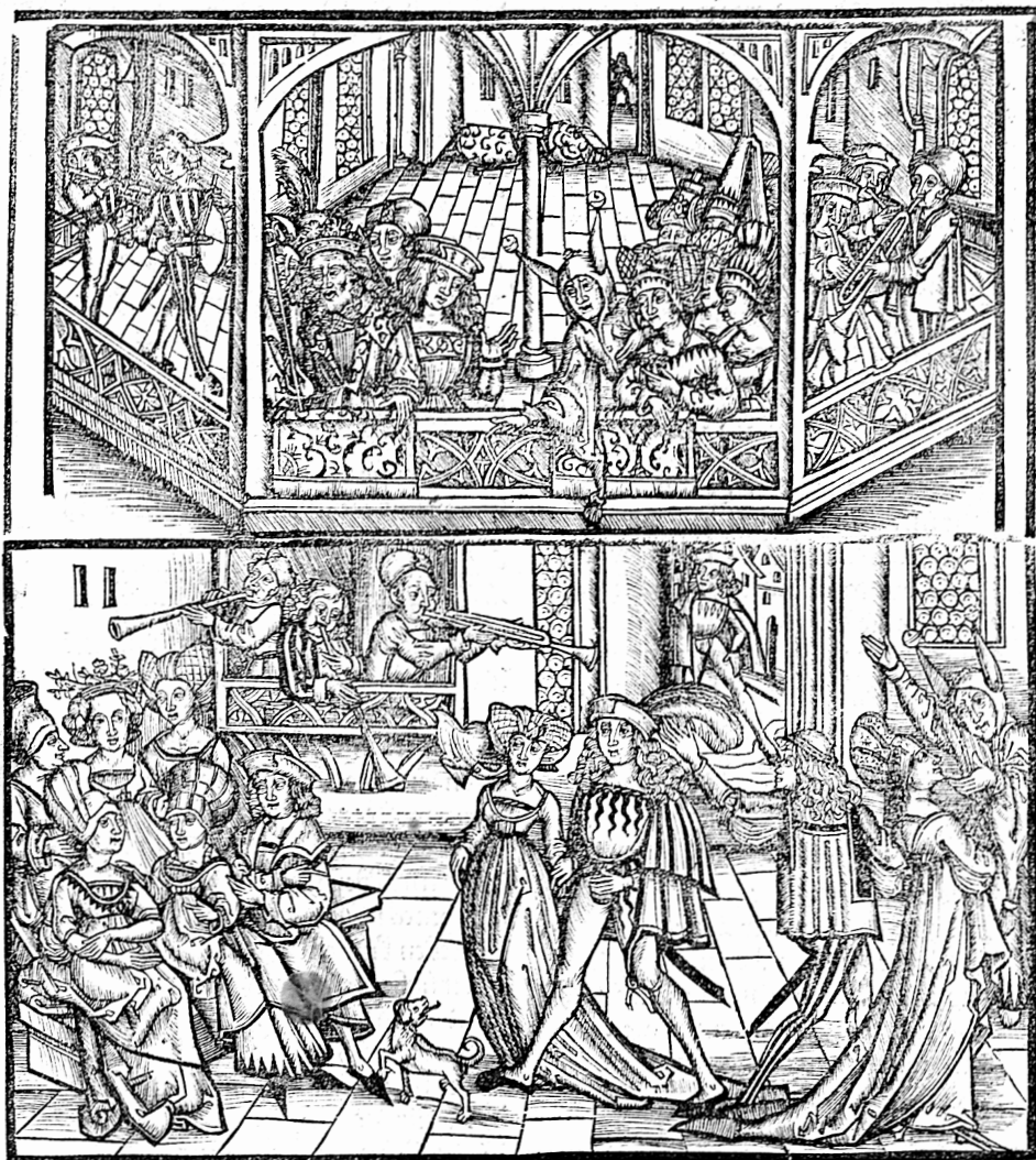
Abb. 262: Holzschnitt [1500], nach: Hans von Büchel, Die Königstochter von Frankreich. HAB Wolfenbüttel 299 Hist. 2°.

Hie was ein köstlicher tantz vnd der danck ward da vß gegeben/ da ward gesehen zierlich vnd frölich alles volck das dar zü geordnet was.