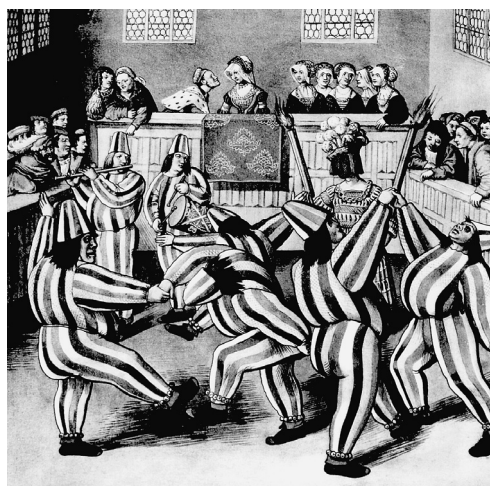
Abb. 265: Groteskmummerei in ausgepolsterten Verkleidungen. Freydal. 1512–1515. Wien, Kunsthistorisches Museum, Kunstkammer (zur Zeit in der Hofjagd- und Rüstkammer) Inv. Nr. P 5073, nach: Freydal, Bl. 164.

Abb. 264: Aufführung des »Mohrenballetts« im Riesensaal der Dresdner Residenz 1678. Kupferstich von Johann Azelt, nach: Gabriel Tzschimmer, Die Durchlauchtigste Zusammenkunfft, Nürnberg 1680, Blatt 106.