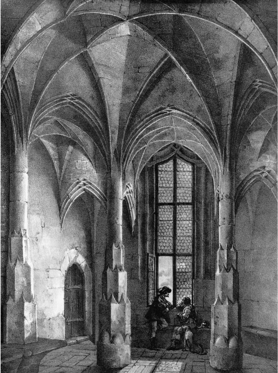
Abb. 210: Albrechtsburg über Meißen ab 1471. Blick in die dem fürstlichen Stubenappartement im zweiten Obergeschoß zugeordnete Schreibstube auf der Elbseite, nach einer Lithografie von C. Werner um 1830, nach: Die Albrechtsburg zu Meißen, hg. von Hans-Joachim MRUSEK, Leipzig 1972, Abb. 20.

Sonderdruck aus: Höfe und Residenzen im spätmittelalterlichen Reich.