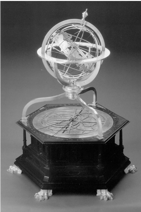
Abb. 237: Jost Bürgi, Armillarsphäre mit astronomischer Uhr, nach: Wunderwerk Göttliche Ordnung und vermessene Welt. Der Goldschmied und Kupferstecher Antonius Eisenhoit und die Hofkunst um 1600 (Katalog der Ausstellung im Erzbischöflichen Diözesanmuseum Paderborn, 2003), Mainz 2003, S. 243.

Sonderdruck aus: Höfe und Residenzen im spätmittelalterlichen Reich.