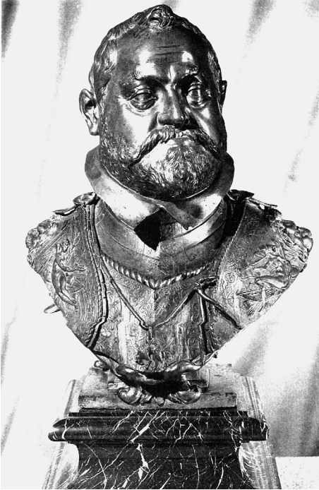
Abb. 236: Adrian de Vries, Büste Kaiser Rudolfs II. im Harnisch mit dem Goldenen Vlies, nach: Prag um 1600, 1988, S. 52.