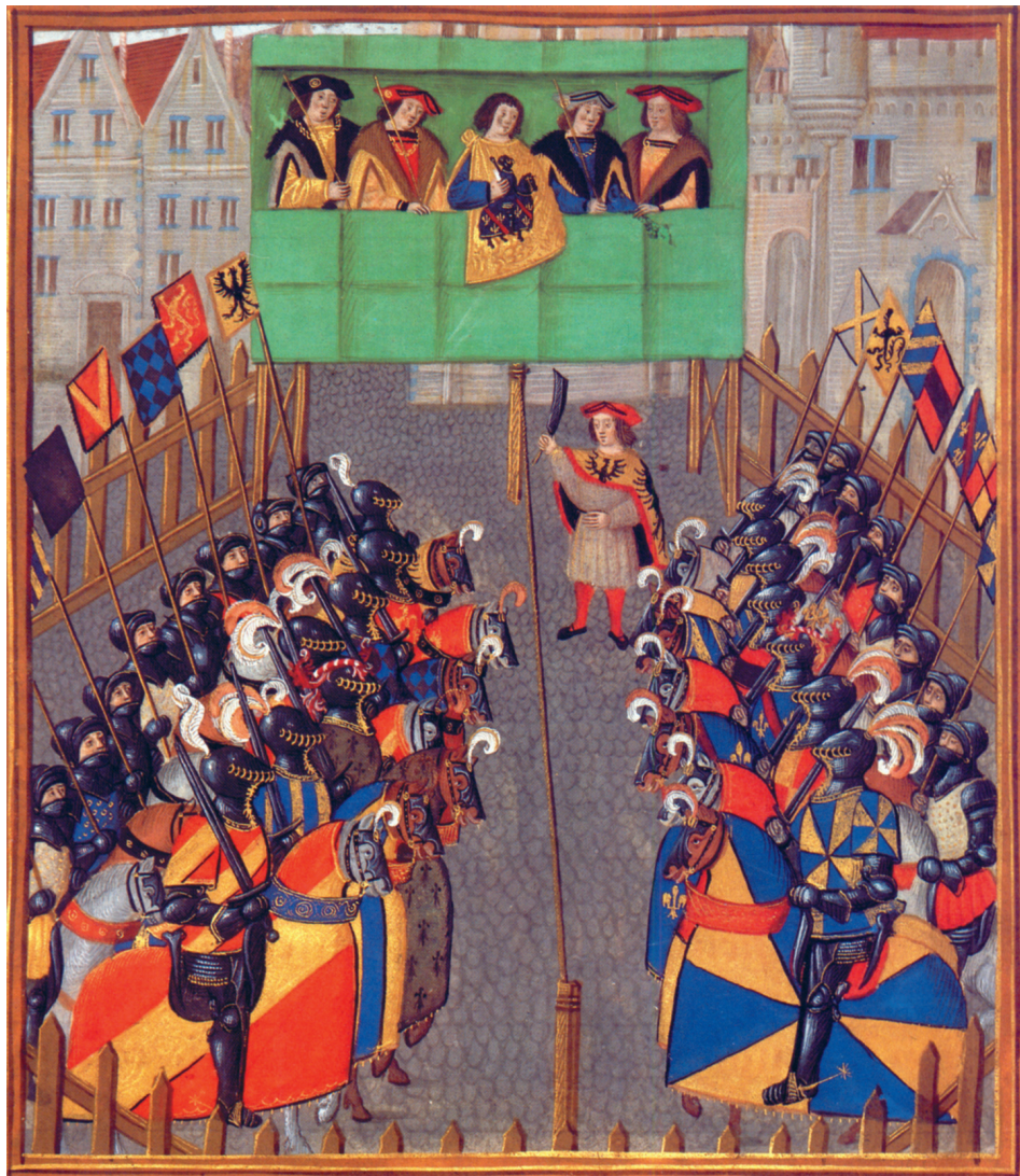
Farbtafel 71: Herolde beim Turnier. Ein Herold hält sich als Berater auf einem Podest bei den Turnierrichtern auf, trägt aber selbst keinen Richterstab. Ein Persevant (gedrehter Tappert) ist im Begriff, das Turnier durch Kappen des die Parteien trennenden Seils zu eröffnen. Turnierbuch des Roi René (1409–1480), Kopie Anfang 16. Jahrhundert: Dresden, Sächsische Landesbibliothek, OC 58, fol. 35 v, nach: KURRAS 1992, S. 40.