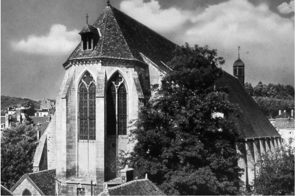
Abb. 184: Tonnerre Hospital, Außenansicht, nach: QUÉNÉE, Noël: L'Hôpital Notre-Dame-des-Fontenilles, La Pierre-qui-vire 1979.