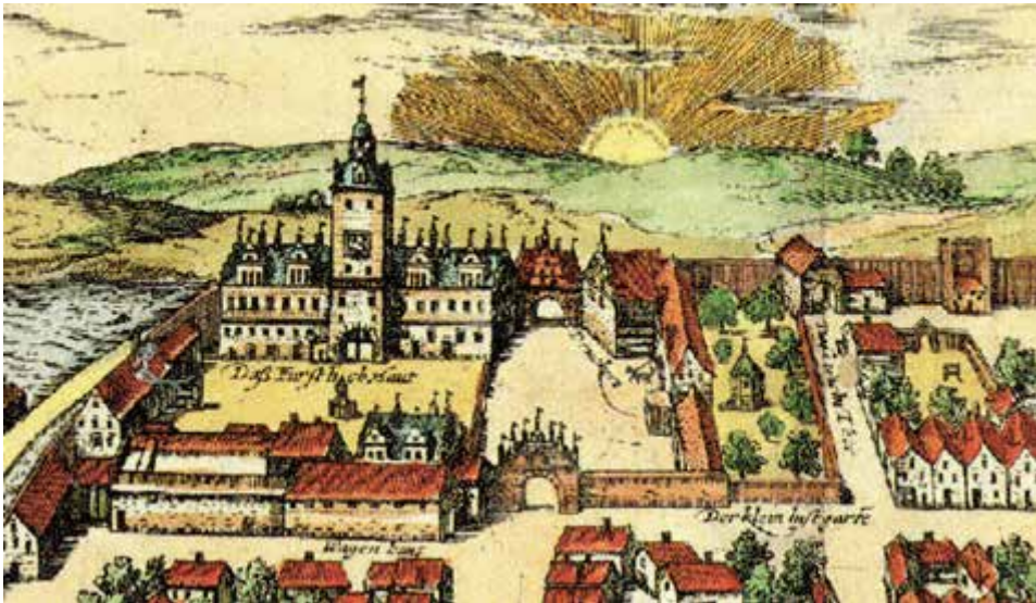
Abb. 2a–b: Franz Hogenberg, Ansicht (Vogelschau) der Stadt Barth in Pommern ( Bardum Pomeraniae ), ca. 1588, kolorierter Kupferstich, aus: Braun, Hogenberg, Civitates orbis terrarum (1599), Taf. 45 (Unter fürstlichem Regiment [2005], S. 58); unten: Ausschnitt