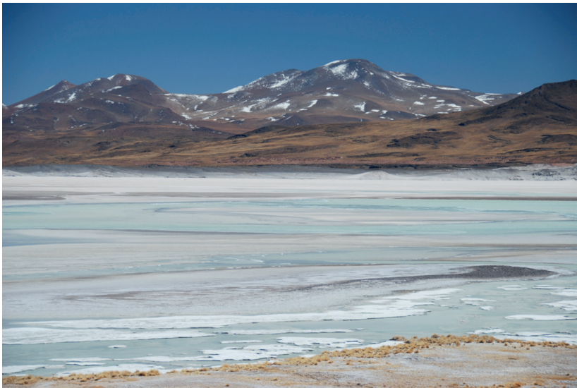
Salzsee in der Atacama-Wüste. Die Sole ist lithiumhaltig und eines der Hauptfördergebiete dieses seltenen Minerals.

Impulsvorträge und Podiumsdiskussion mit Gerhard Wörner (Göttingen) und Nicole Ludwig (Tübingen)