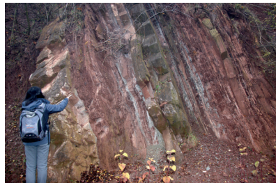
Ehemalige Seeablagerungen der unteren Trias am alten Bahneinschnitt in Thale