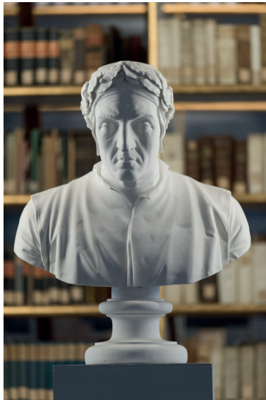
Dante-Büste im Rokokosaal der Anna Amalia Bibliothek in Weimar.

Giotto und Dante als Erneuerer der Kunst und Dichtung im Urteil der Frührenaissance