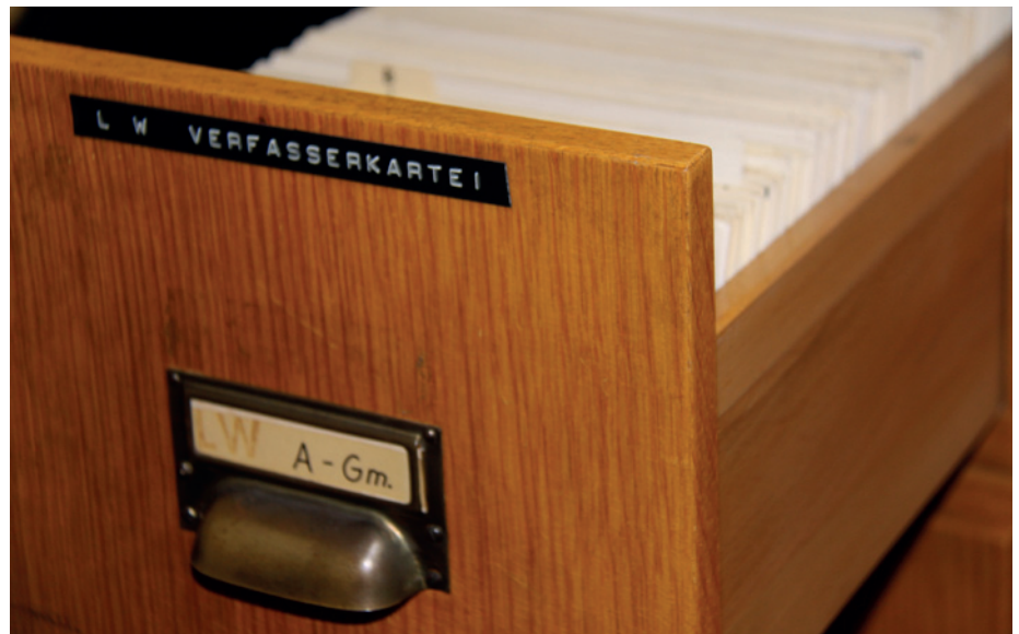
Ein Zettelkasten in der Göttinger Arbeitsstelle des Deutschen Wörterbuchs

Dies wird auch im Hinblick auf das Qumran-Wörterbuchprojekt der Göt-