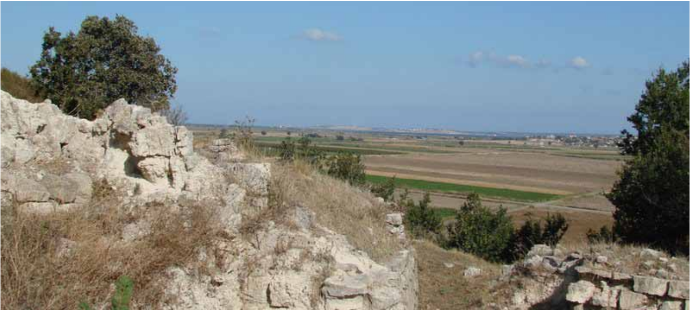
Akropolis von Troia mit Blick auf die Dardanellen.