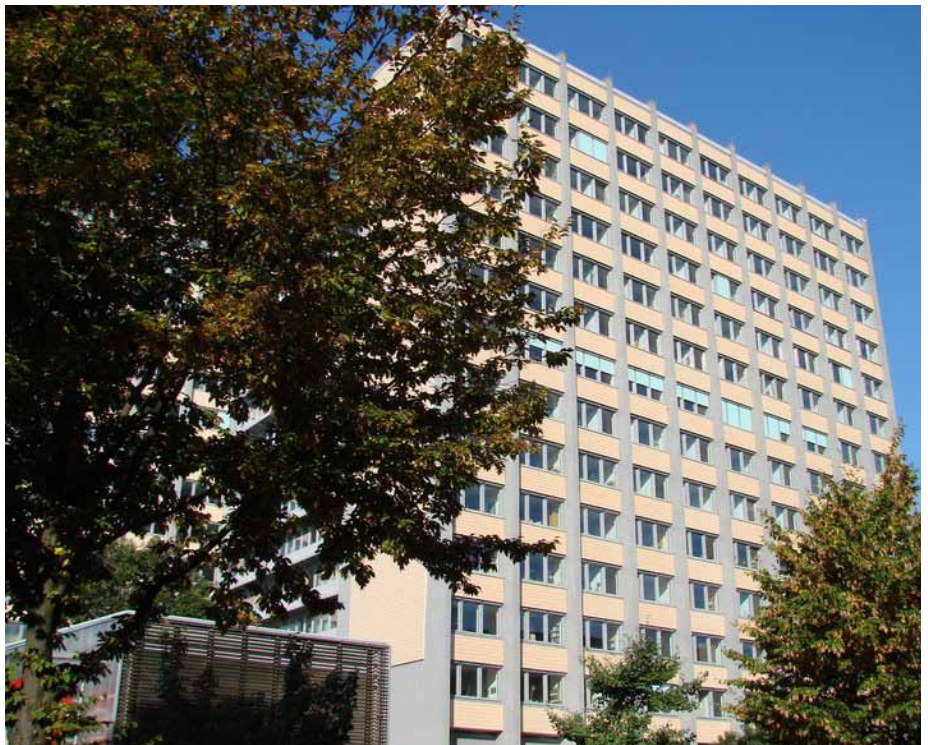
„Philosophenturm“ im Von-Melle-Park der Universität Hamburg. Hier im 8. Stock entstand das Lexikon.