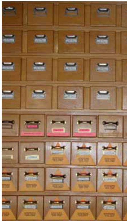
Zettelkästen in der Homerbibliothek

VL: Und noch ein paar Stichworte: Homer war im ganzen griechi-