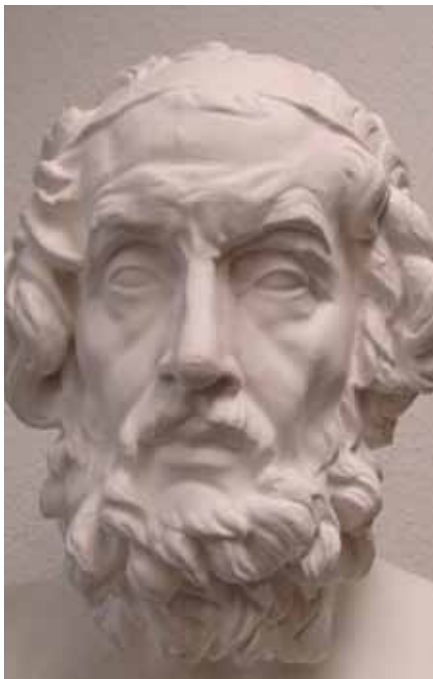
Gipsabguss des Homerbildnisses im Louvre

HWN: Als im 8./ 7. Jh. v.Chr. die Werke Homers und Hesiods entstanden, gab es den geographischen kulturellen Begriff „Europa“ noch nicht. Homers Ilias und Odyssee wurden aber für die Griechen, und dann auch für uns übrige Europäer, der älteste schriftlich erhaltene Text in einer der nachmaligen europäischen Sprachen. Sie wurden die „Schule Griechenlands“, aus der die Griechen in Pro und Contra ihre Vorstellungen von