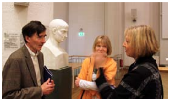
Bilder einer Ausstellung...